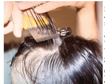
Algunas instrucciones incluyen peinar el pelo para sacar los piojos y las liendres.

Jim Kalisch, UNL Departamento de Entomología