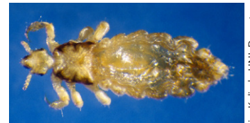
Piojos adultos magnificados, los cuales son del tamaño de las semillas de sésamo.